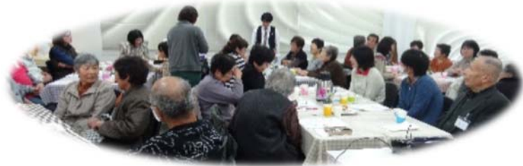
つどいカフェスタッフ

2016年1月16日(土)第5回きんたろうつどいカフェを開催しました。今回は「家族が認知症になったら～対応の仕方応用編～」認知症の関わりについて、グループで話し合い、発表し、講師に総評していただくスタイルをとりました。気軽にお話できる雰囲気です。リフレッシュできたこと好評でした。