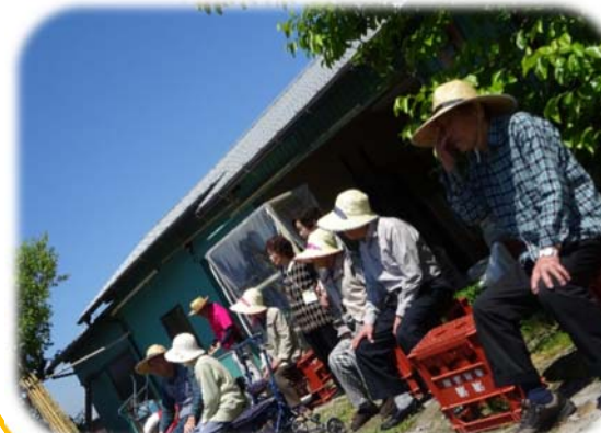
つどい庵スタッフ

デイサービスつどいでは、機能訓練の為に外出や室内での運動に加え、習字やカラオケ、将棋、囲碁等それぞれ、思い思いの時間を過ごしていただいています。これからも皆さんに笑顔いっぱい、生き生きと過ごしていただけるようスタッフ一同頑張ります！